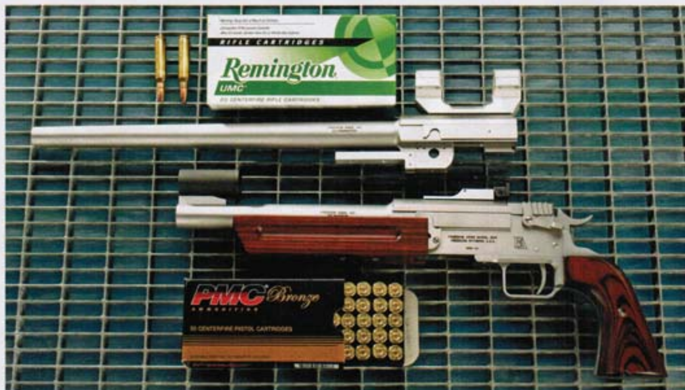
Die einschüssige Kipplaufpistole M 2008 von Freedom Arms gibt es in verschiedenen Kalibern – hier mit einem zehn Zoll langen Lauf im Kaliber .357 Magnum. Alternativ dazu testete VISIER die Waffe noch mit einem 15-Zoll-Wechsellauf in .223 Remington. Beim Material der Waffe handelt es sich um Stainless Steel, fein sandgestrahlt. Griffschalen und Vorderschaft bestehen aus lackiertem Schichtholz. Preis (laut Lieferant The Duke): 2190 Euro, 223er Wechsellauf: 790 Euro.

schen Stahl und Holz überzeugen durch Formschlüssigkeit. Alle weiteren Passungen bestehen durch geringe und gleichmäßige Spaltmaße – ein Indiz für niedrige Toleranzen und somit aufwändige Fertigungsverfahren. Über die Art der verbauten Schrauben kann man hingegen streiten: Traditionalisten mögen Schlitzschrauben vorziehen, alle anderen halten sie nicht für zeitgemäß: Der Schraubenkopf verschleißt recht fix und mindert somit das hochwertige Äußere der Pistole. Hier hätten sich die Tester standfestere Inbus- oder Torxschrauben gewünscht. Am Verschlussblock und um den Abzugsbügel erspähte man geringe Rattermarken vom Fräsen – das war es dann auch mit der Kritik.