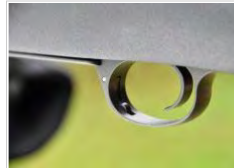
Der Abzug der Repetierbüchse Kimber 84M LPT kann vom Schützen individuell eingestellt werden.

Der Abzug ist individuell einstellbar. Ab Werk liegt das Abzugsgewicht grob zwischen 1.360 g und 1.590 g. Dabei steht der Abzug trocken und bricht nach Erreichen des Widerstands glashart.