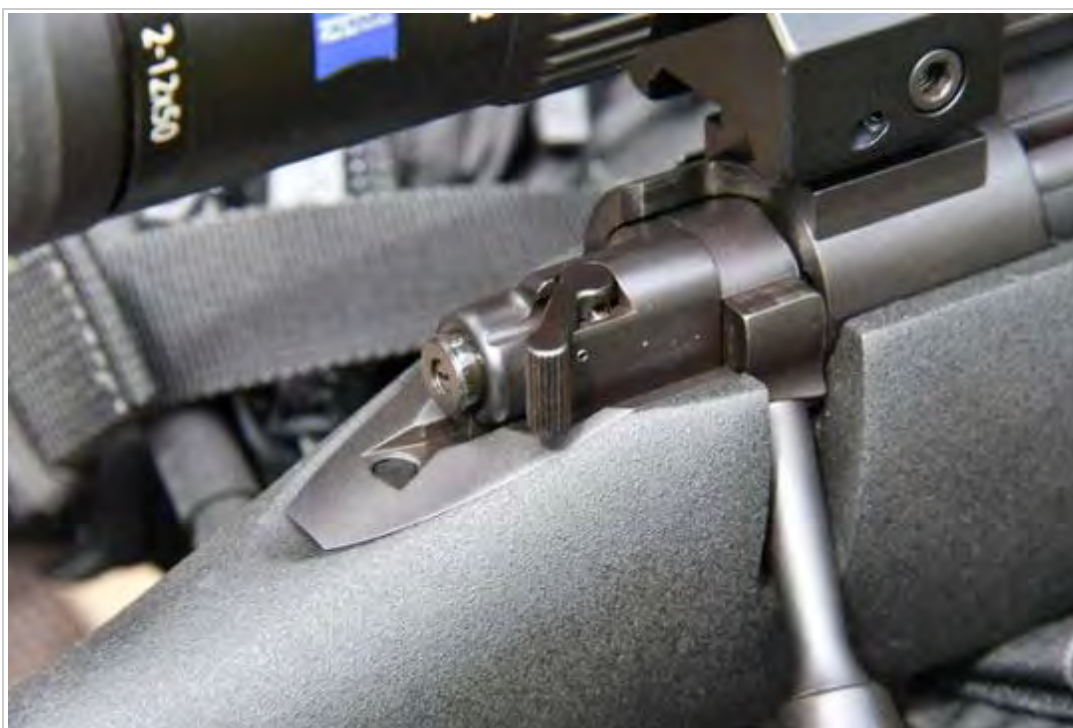
Die 3-Stellungs-Sicherung der Kimber 84M LPT in .223 Remington.